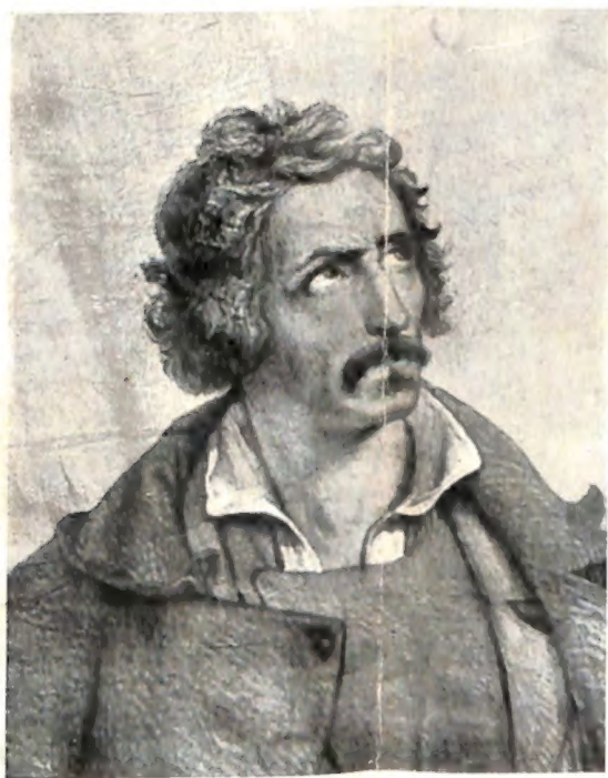
Giuseppe Rosi nel 1849.